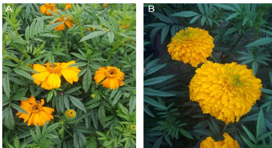
Figura 2. Fotos de inflorescencias de cempoalxóchitl. Se presentan distintos tipos de inflorescencias de cempoalxóchitl. En el panel A, se presenta una inflorescencia con un solo anillo de lígulas y en el centro se encuentran flores tubuladas sin lígulas hermafroditas. En el B, una inflorescencia de flores hembras con lígulas (se ha descrito un tipo de inflorescencias hembras sin lígulas).

El nombre científico del cempoalxóchitl es Tagetes erecta . Tagetes pertenece a la familia Asteraceae y está constituido por alrededor de 55 especies de plantas herbáceas anuales o perennes (Serrato-Cruz et al., 2008). Esta planta ramificada puede llegar a medir aproximadamente 1.5 m de altura y presentar distintas formas de inflorescencias. Estas pueden estar conformadas por varios tipos de flores, como las flores liguladas (hembras) o sin ligulas (hermafroditas). El arreglo de estas flores va desde inflorescencias con solo un anillo exterior de flores liguladas (hembras) y en su centro presencia de flores hermafroditas tubuladas, inflorescencias que presentan varios anillos de flores liguladas y pocas flores tubuladas hermafroditas en el centro, hasta las que solo presentan flores hembra sin presencia de fuentes de polen (Figura 2 A y B).