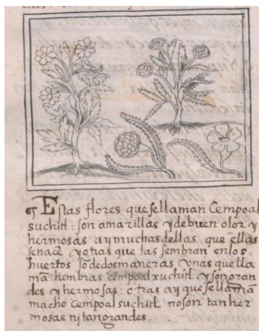
Figura 1. Flores de cempoalxóchitl en el Códice Florentino. Se observa una copia del Códice Florentino “Estas flores que se llaman cempoalxóchitl son amarillas y de buen olor, y hermosas. Hay muchas de ellas que ellas se nacen y otras que las siembran en los huertos. Son de dos maneras: unas que llaman hembras cempoalxóchitl, y son grandes y hermosas; otras hay que se llaman macho cempoalxóchitl: no son tan hermosas ni tan grandes”. Códice Florentino Folio 186v, 1577.

El cempoalxóchitl (del náhuatl cempoalli que hace referencia al número 20 y xochitl flor), es una planta endémica de México. Se considera que los aztecas fueron los primeros en atribuirle propiedades medicinales, por lo que su uso se diseminó hacia América central y Sudamérica. El primer reporte del cempoalxóchitl data de 1552 plasmado en el “Herbal Azteca De La Crus-Badiano” (Gupta et al., 2022). Tiempo después fue descrita por el fraile franciscano Bernardino de Sahagún en el Códice Florentino la flor de cempoalxóchitl (Figura 1) e introducida en Europa en el siglo XVI. Posteriormente, las semillas de cempoalxóchitl fueron transportadas al norte de África, donde fue naturalizada y a finales del siglo XVI fue introducida en la India proveniente de Portugal (Shukla y Thakur 2018).